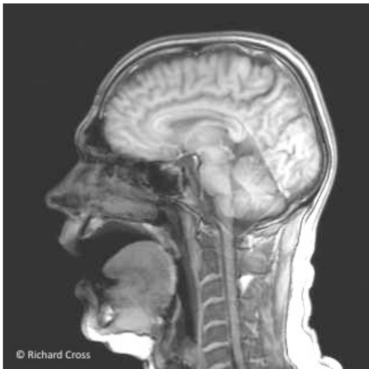
Jet d'air Nasal "Moïto"